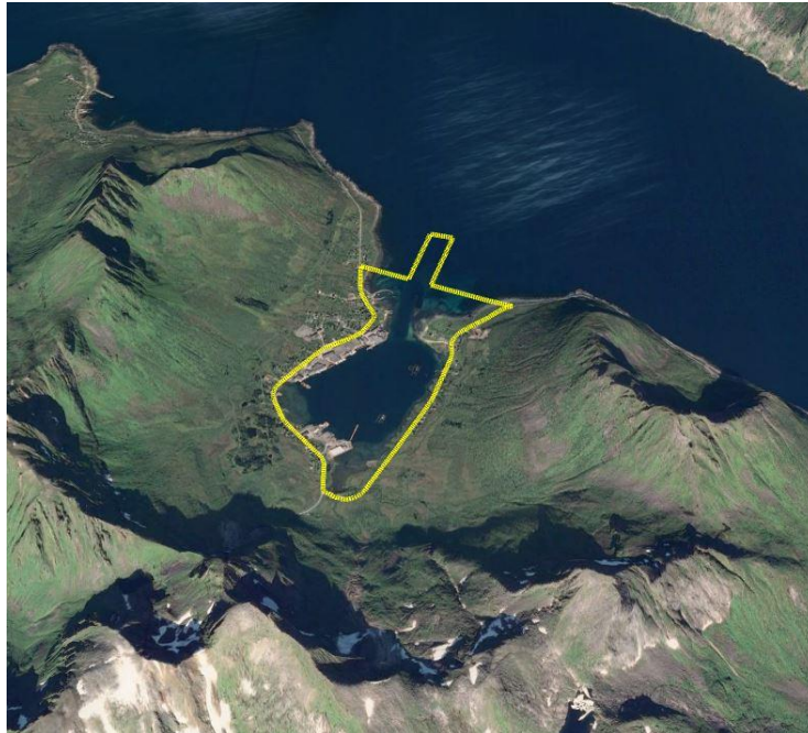
FIGUR 1: OVERSIKT OVER PLANOMRÅDET (GOOGLE)

Figur 1 viser planområdets beliggenhet avmerket med gult.