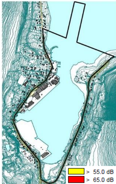
FIGUR 4: VEGTRAFIKKSTØY - FV 252 OG FV862 (4 METER OVER TERRENGET) – ÅR 2037