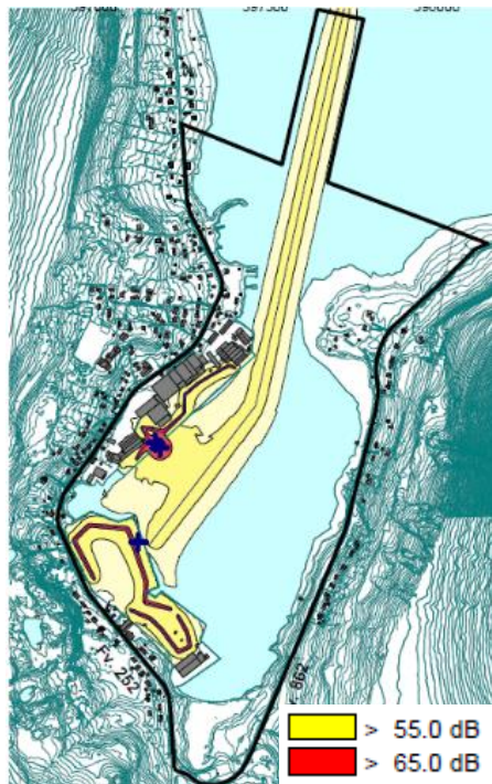
FIGUR 2: STØY FRA HAVN - UTBYGGET SITUASJON (1,5 METER OVER TERRENGET) - DRIFT VED AVGANG/ANKOMST AV BÅT

Figur 2, Figur 3, Figur 4 og Figur 5 er utsnitt fra støyutredningen utført av konsulentfirmaet Asplan Viak den 23.06.2017.