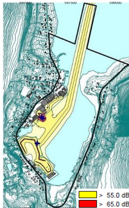
FIGUR 3: STØY FRA HAVN - UTBYGGET SITUASJON (4 METER OVER TERRENGET) - DRIFT VED AVGANG/ANKOMST AV BÅT