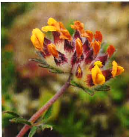
Fjellrundbelg ( Antyllis vulneraria ).

Innenfor planområdet er det beskrevet en rødlisteart (nær truet): Bakkesøte ( Gentilla campestris ) og en såkalt ansvarsart: Fjellrundbelg ( Antyllis vulneraria ). Forekomsten er beskrevet innenfor et større område enn det som berøres av reguleringsplanen. Det foreslås at forholdet til biologisk mangfold ivaretas i en forvaltningsplan for området slik at viktigheten av dette temaet blir ivaretatt på en tilfredsstillende måte. På dette grunnlag er det konkludert med at dette ikke får betydning for realiseringen av prosjektet Ersfjordstranda friluftsområde.