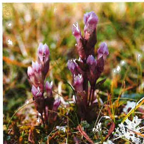
Bakkesøte ( Gentilla campestris )